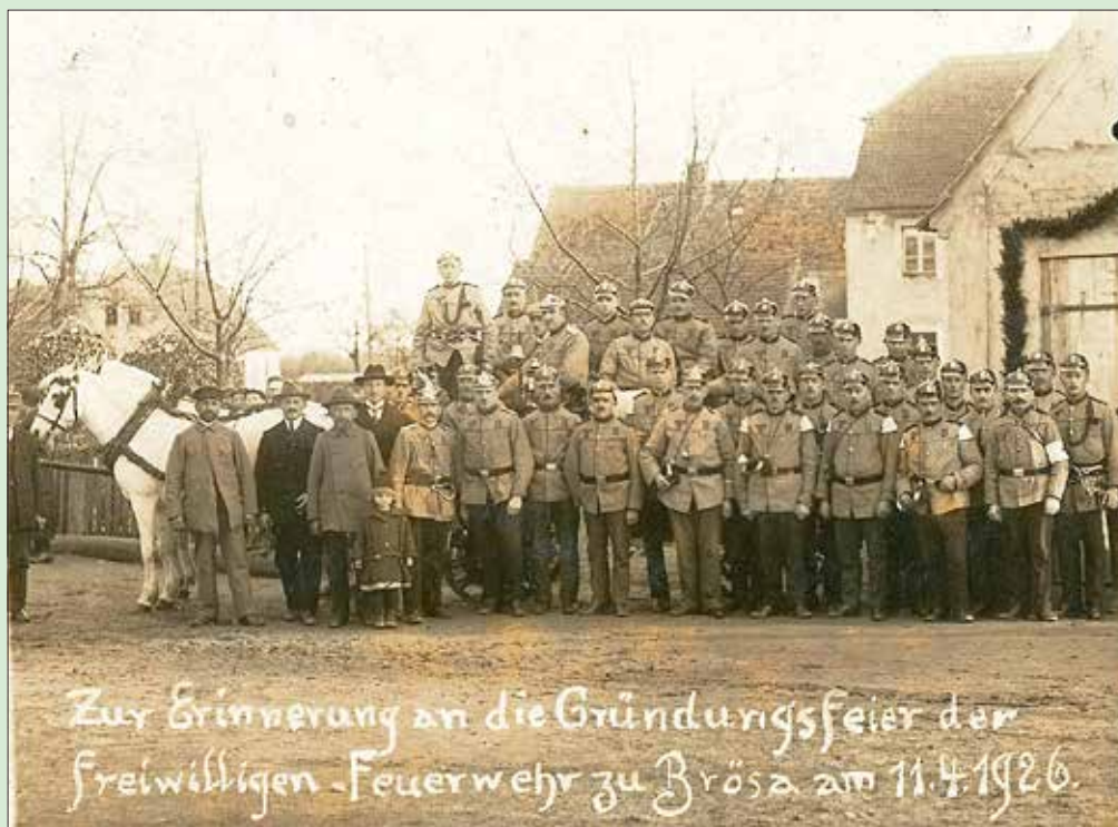
Gründungsfeier der Brösaer Feuerwehr am 11. April 1926

Die Freiwillige Feuerwehr von Guttau und Brösa - damals und heute