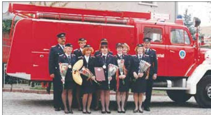
Frauenfeuerwehrrsport, Sachsenmeisterinnen 1994