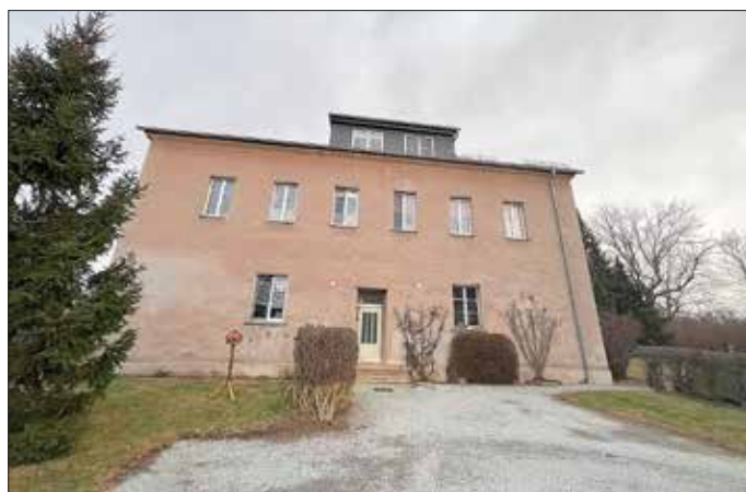
Alte Schule Baruth