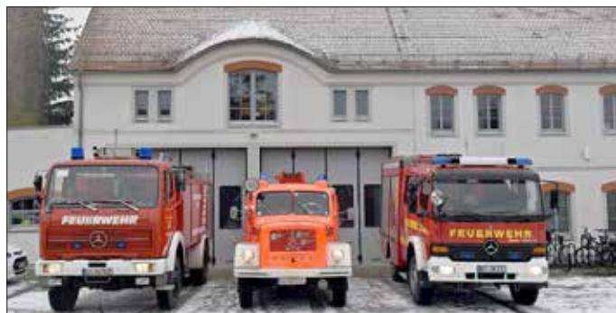
Das 2011 neu errichtete Feuerwehrgebäude in Gutttau